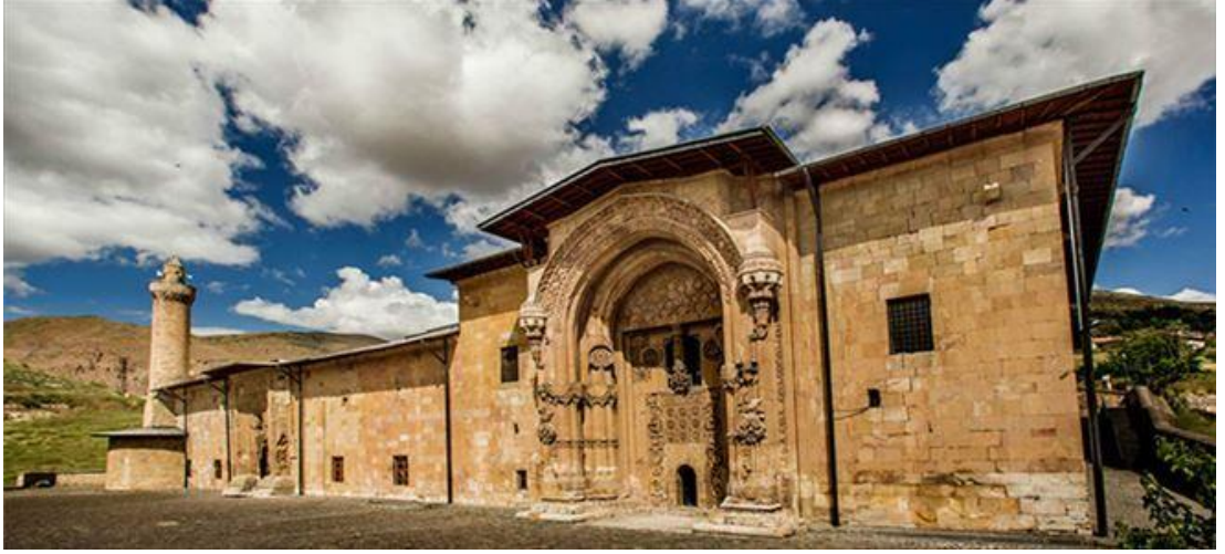
Resim 1.1: Sivas Divriği Ulu Camii'nden bir görüntü